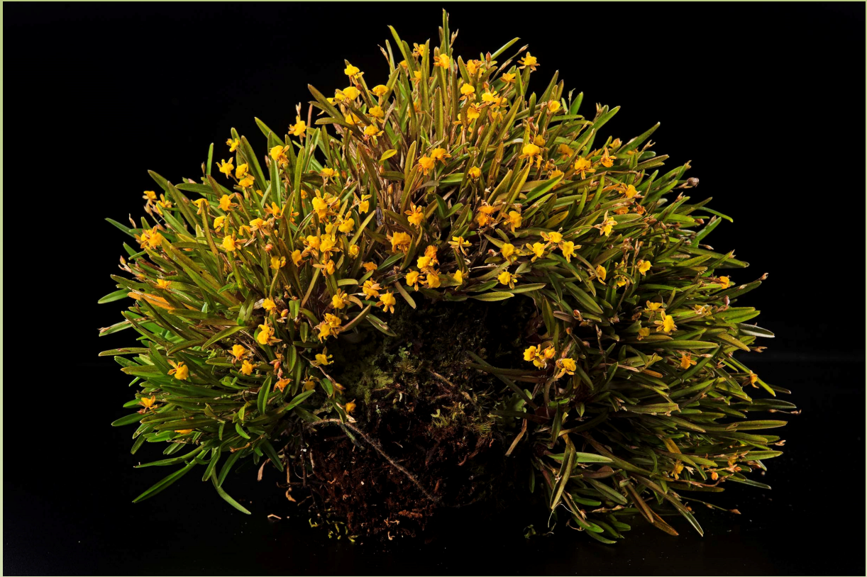
Oncidium gramineum "Nicolasa"