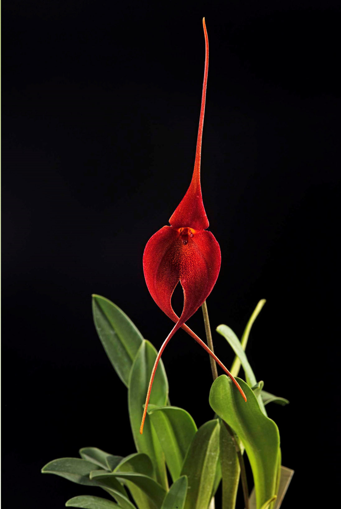
Masdevallia Urubamba "Gabriel Arias"