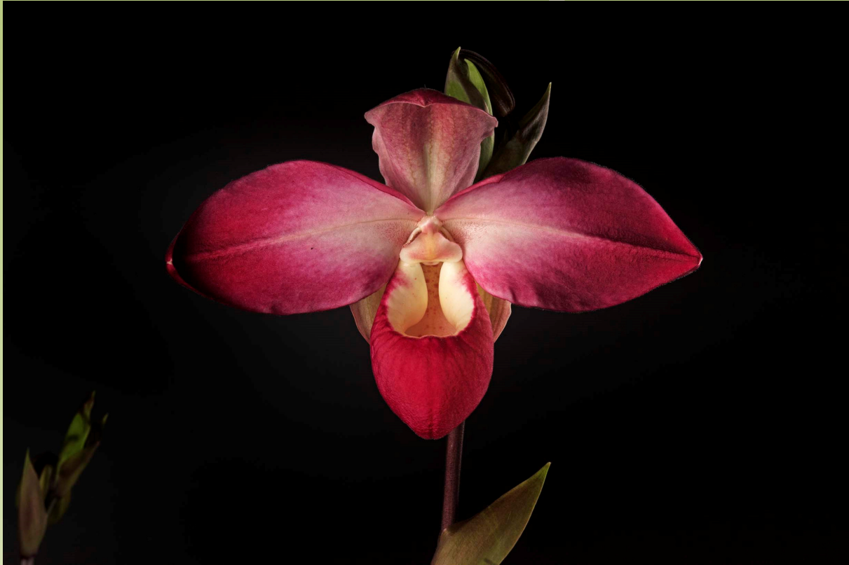
Phragmipedium Susan Decker "Teresa" FCC/90