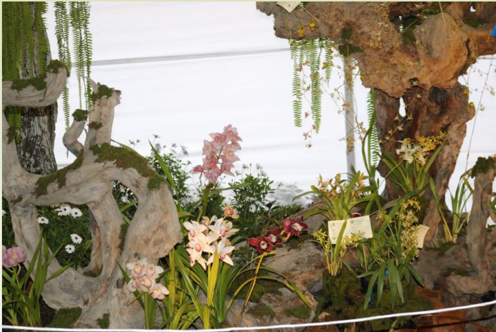
Jardín Temporal “Orquidaria”