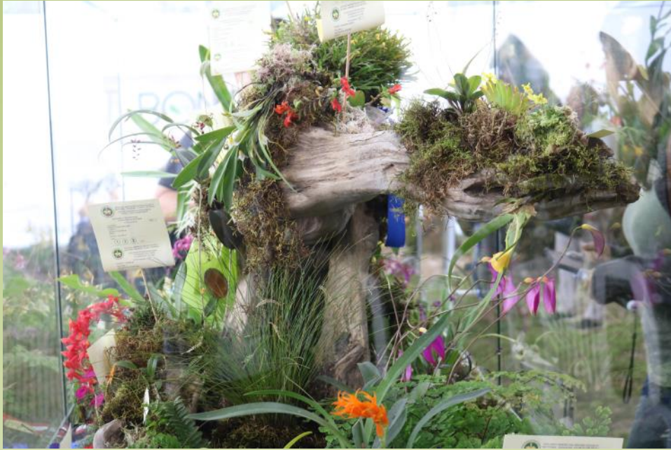
Detalle del Jardín Temporal “Orquídeas Amazónicas”